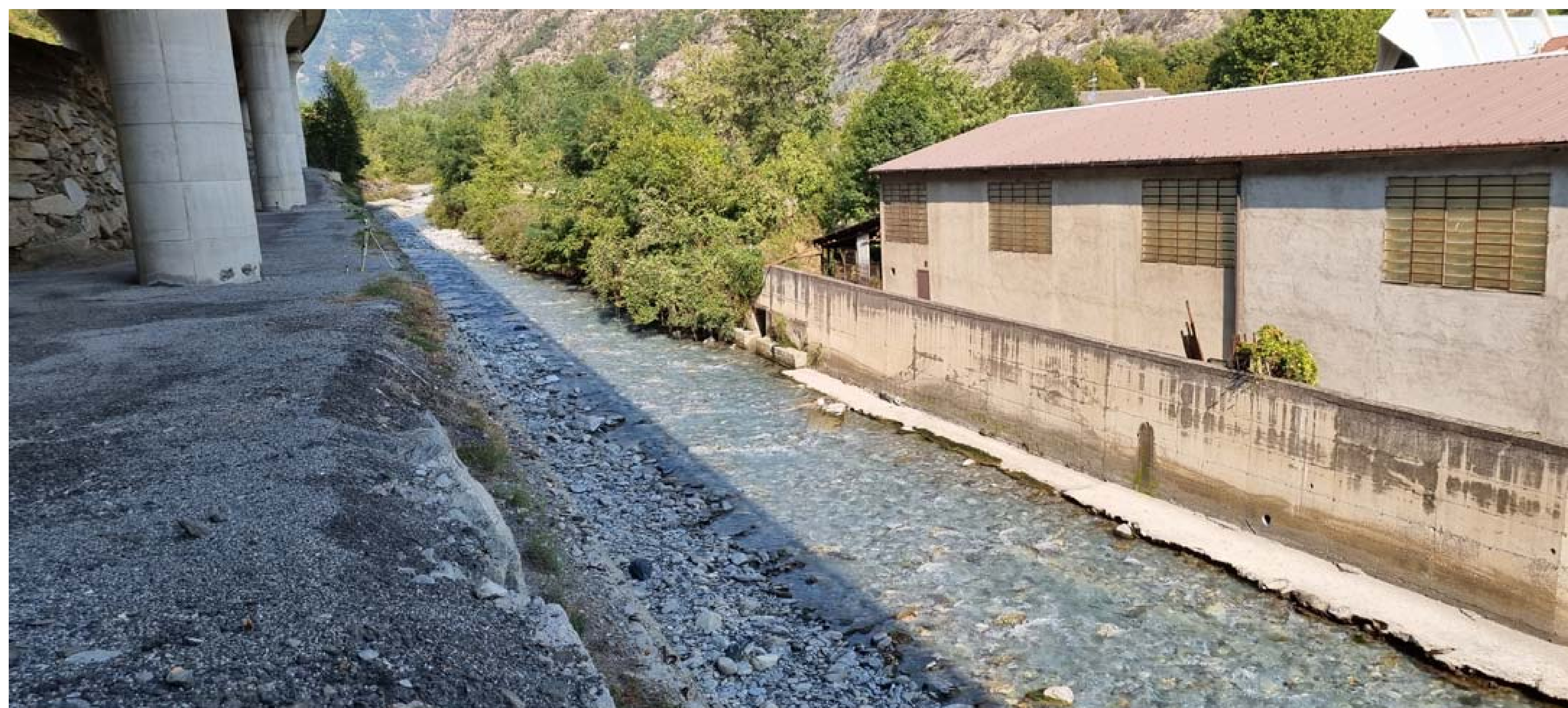
Foto 1 - Panoramica con vista da valle del Torrente Cenischio - Stato di fatto