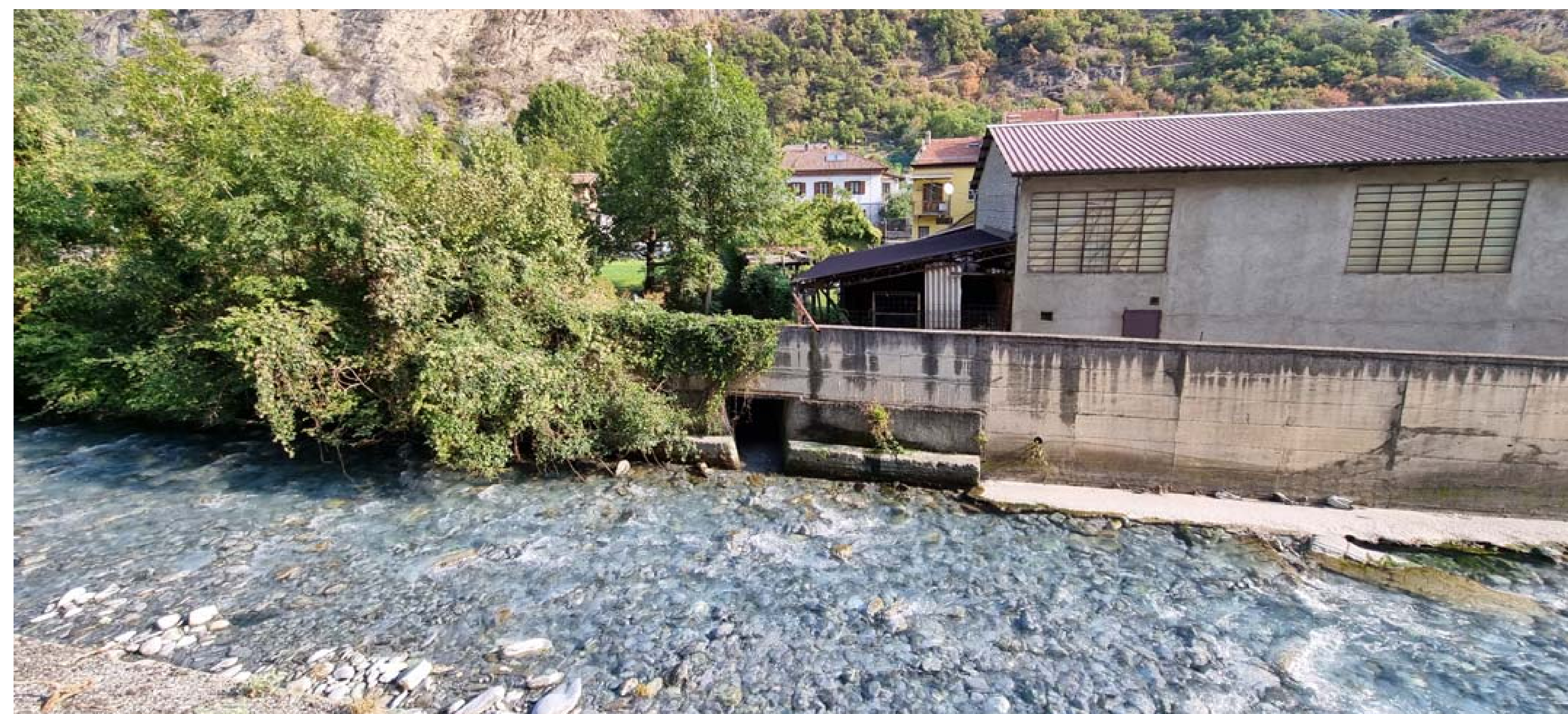
Foto 2 - Punto di confluenza del rio Bertabuello nel Torrente Cenischio - Stato di fatto