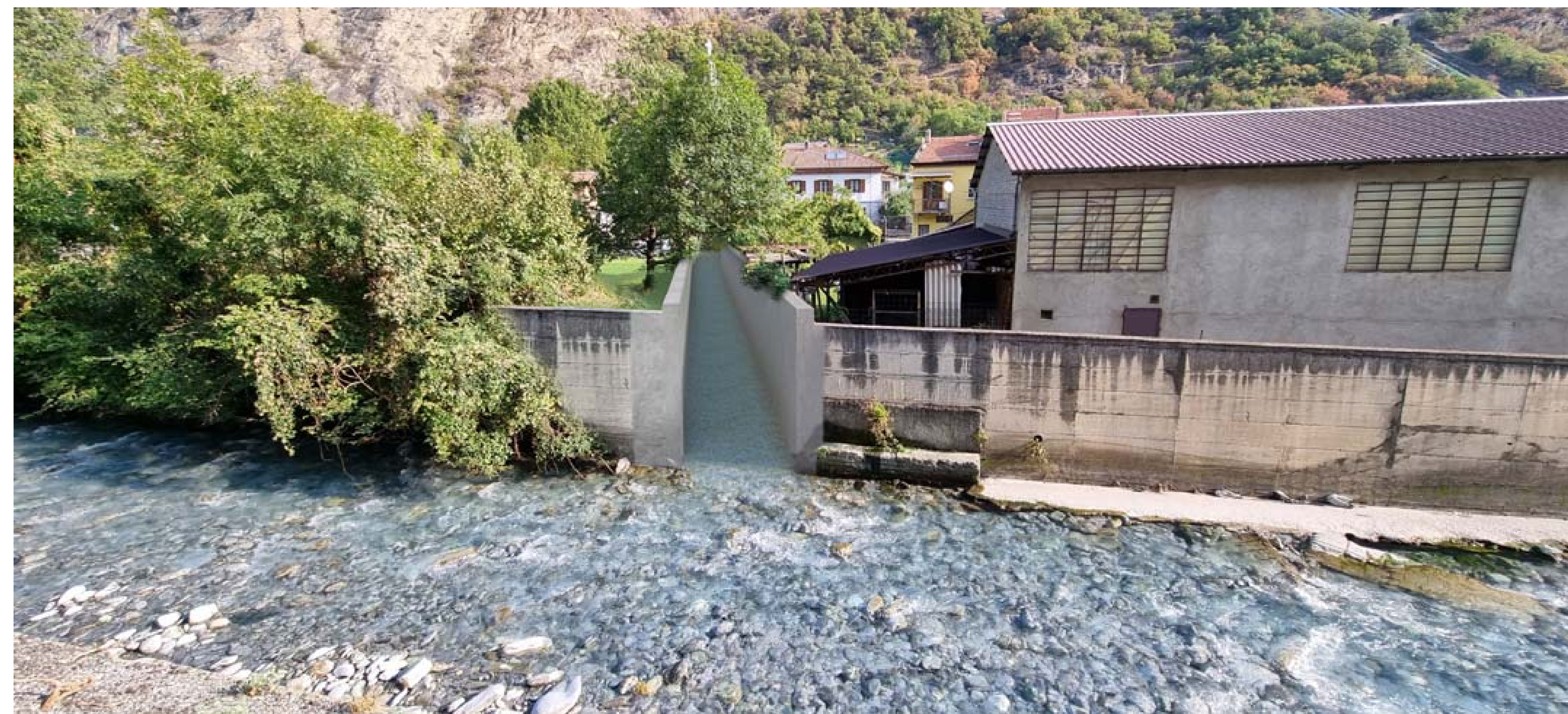
Foto 2 - Punto di confluenza del rio Bertabuello nel Torrente Cenischio - Stato di progetto