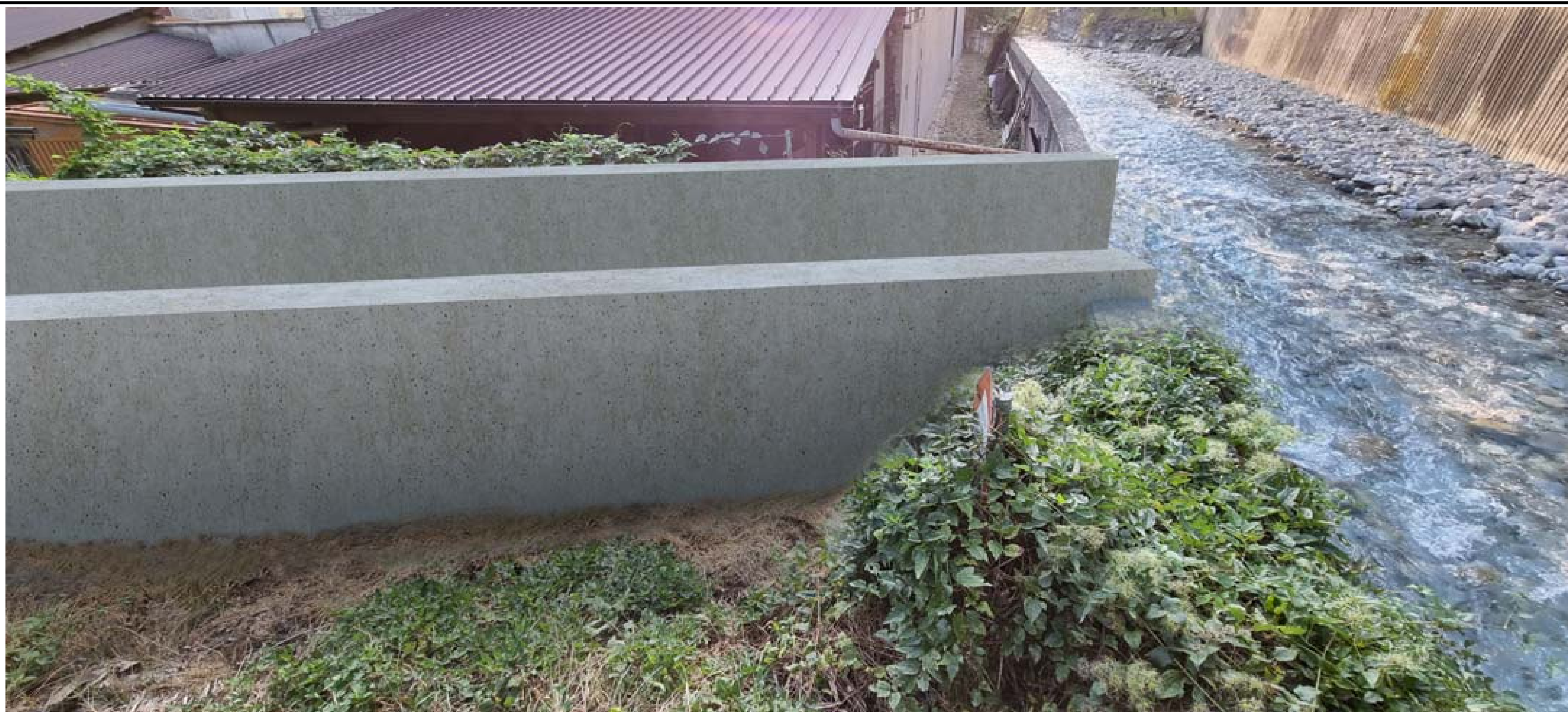
Foto 3 - Tratto terminale del rio Bertabuello in corrispondenza della confluenza nel Torrente Cenischia - Stato di progetto