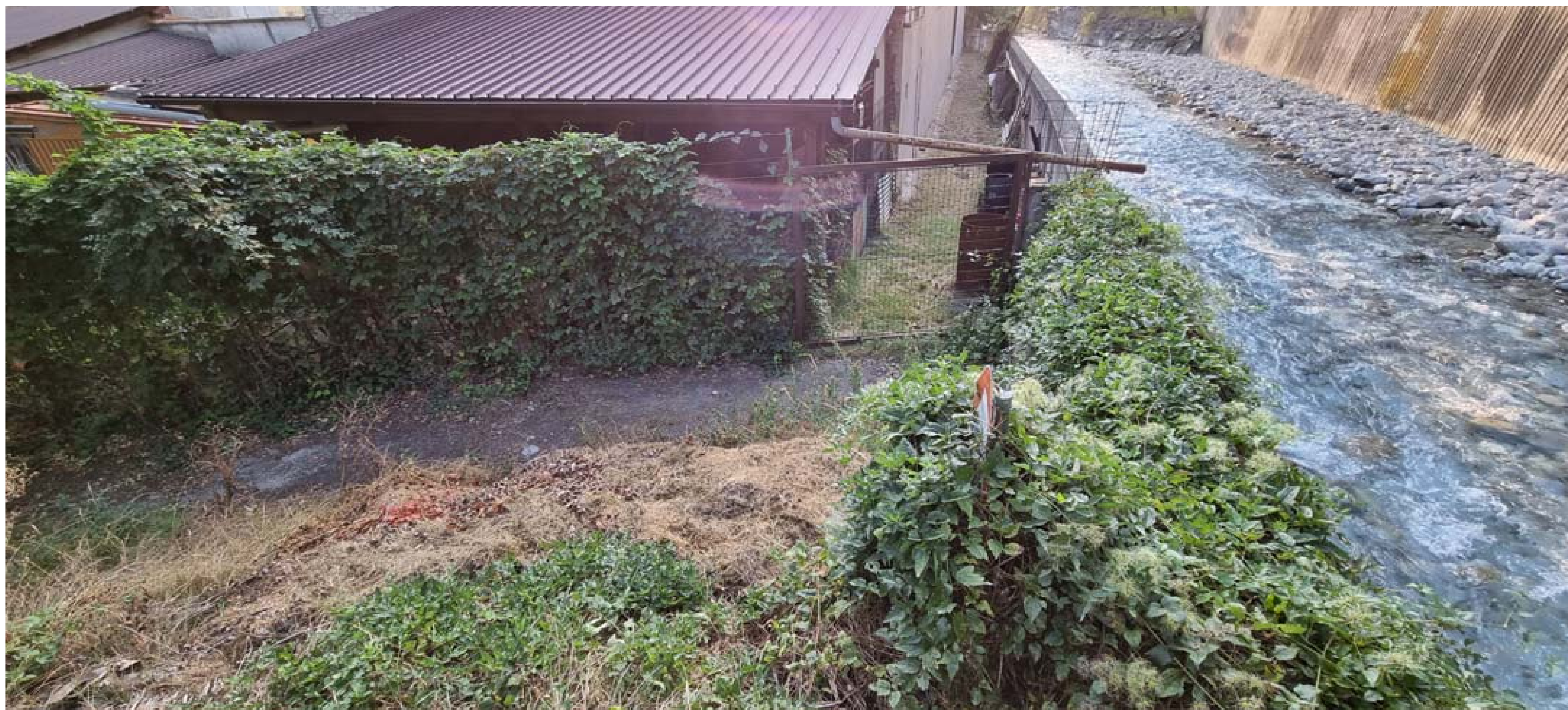
Foto 3 - Tratto terminale del rio Bertabuello in corrispondenza della confluenza nel Torrente Cenischia - Stato di fatto