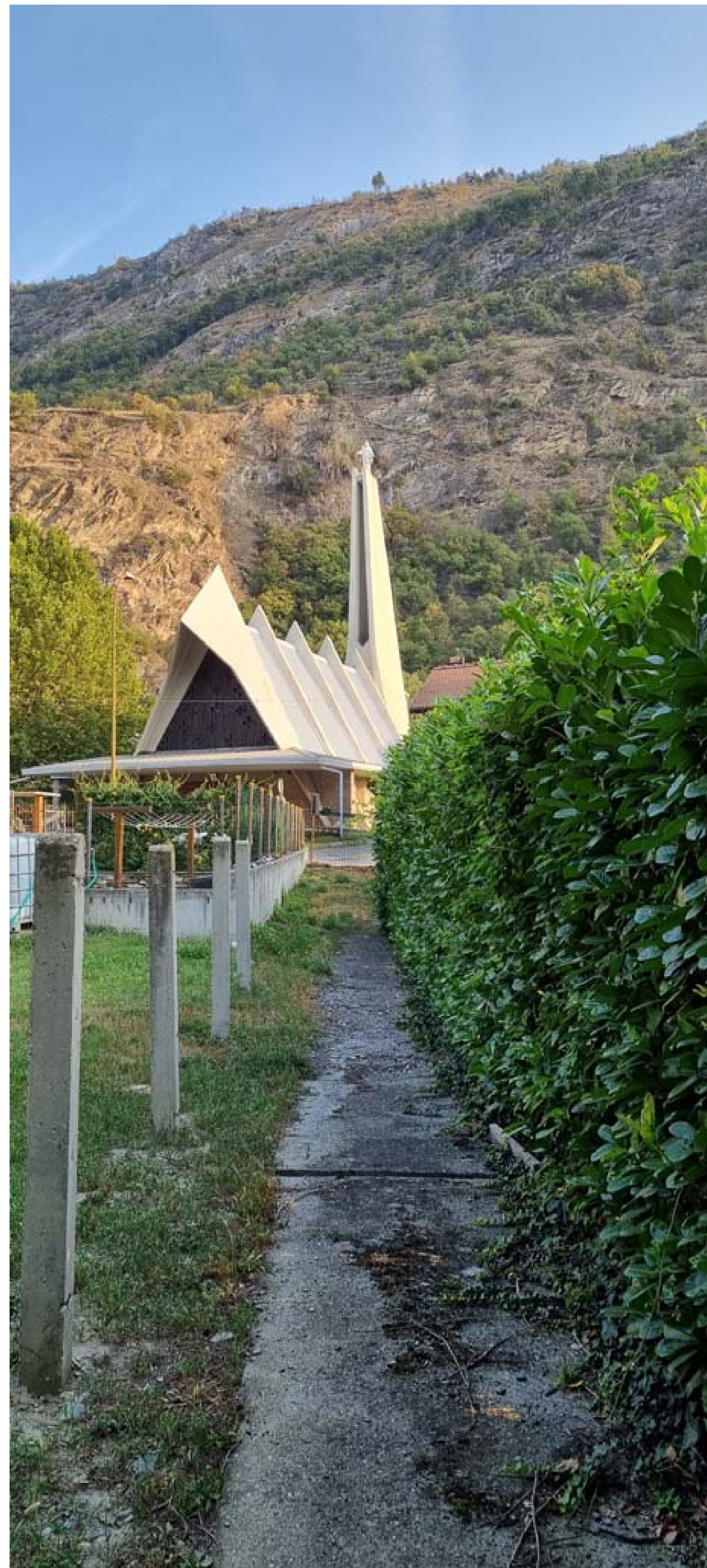
Foto 4 - Vista da valle del tratto terminale del rio Bertabuello - Stato di fatto