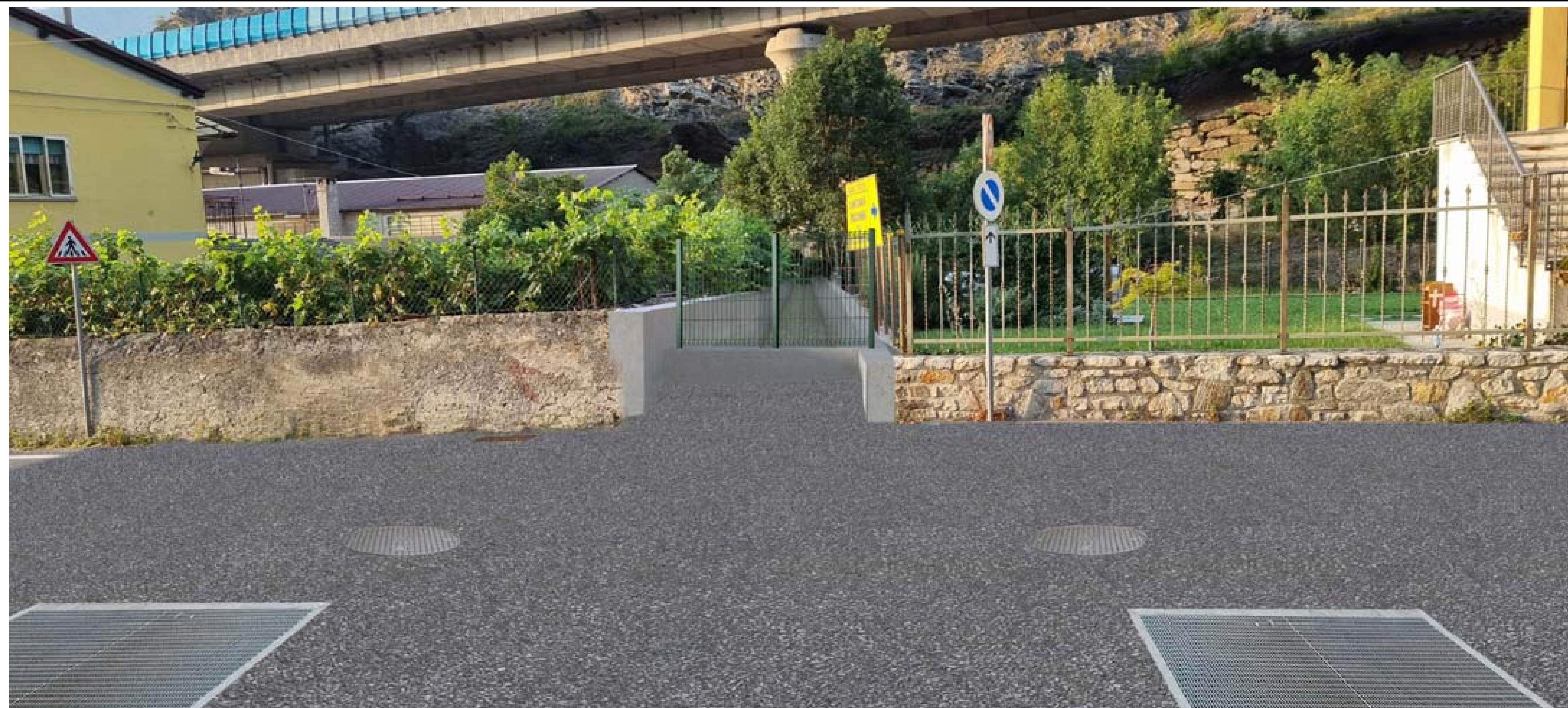
Foto 5 - Vista da monte del rio Bertabuello in corrispondenza dell'attraversamento della strada provinciale - Stato di progetto