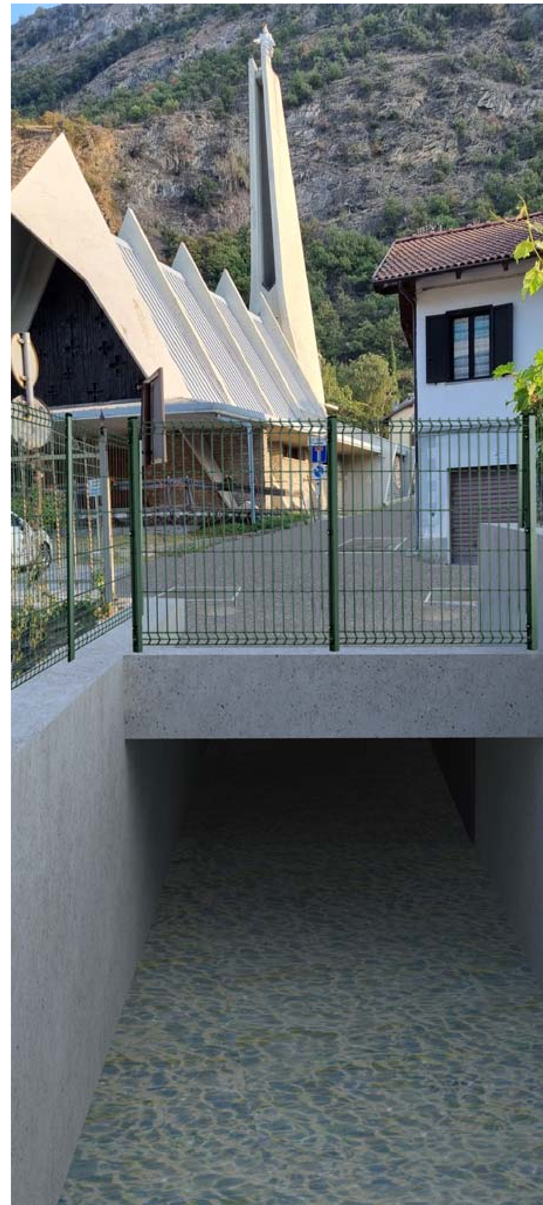
Foto 6 - Vista da valle del rio Bertabuello in corrispondenza dell'attraversamento della strada provinciale - Stato di progetto