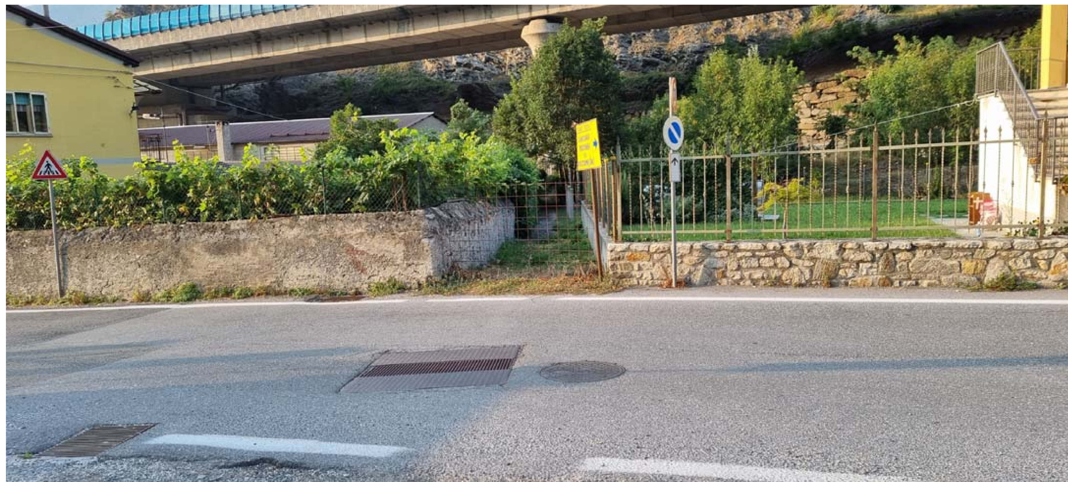
Foto 5 - Vista da monte del rio Bertabuello in corrispondenza dell'attraversamento della strada provinciale - Stato di fatto