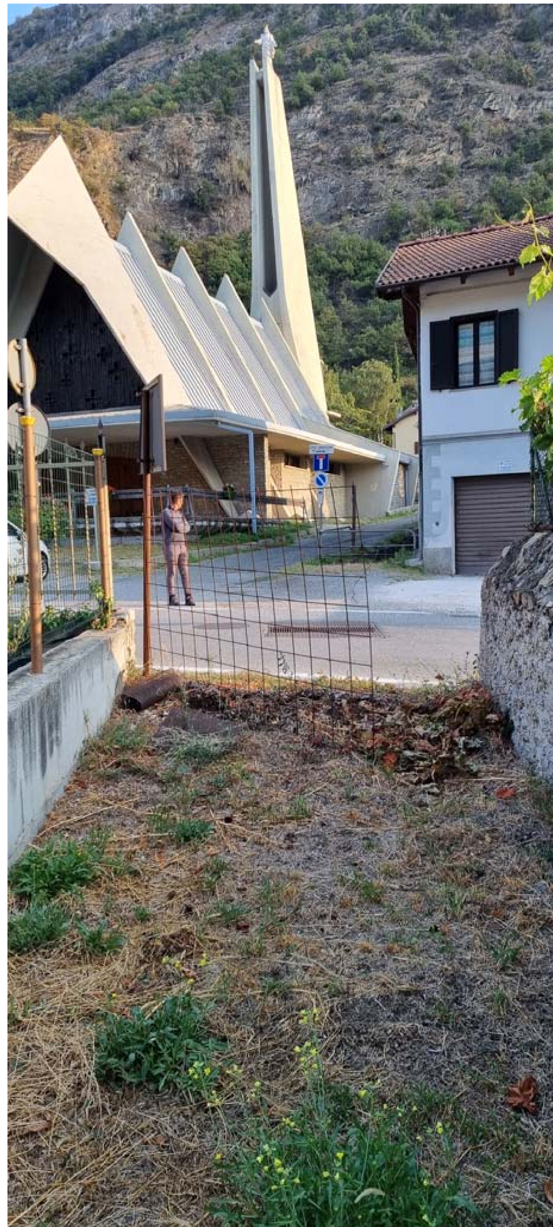
Foto 6 - Vista da valle del rio Bertabuello in corrispondenza dell'attraversamento della strada provinciale - Stato di fatto