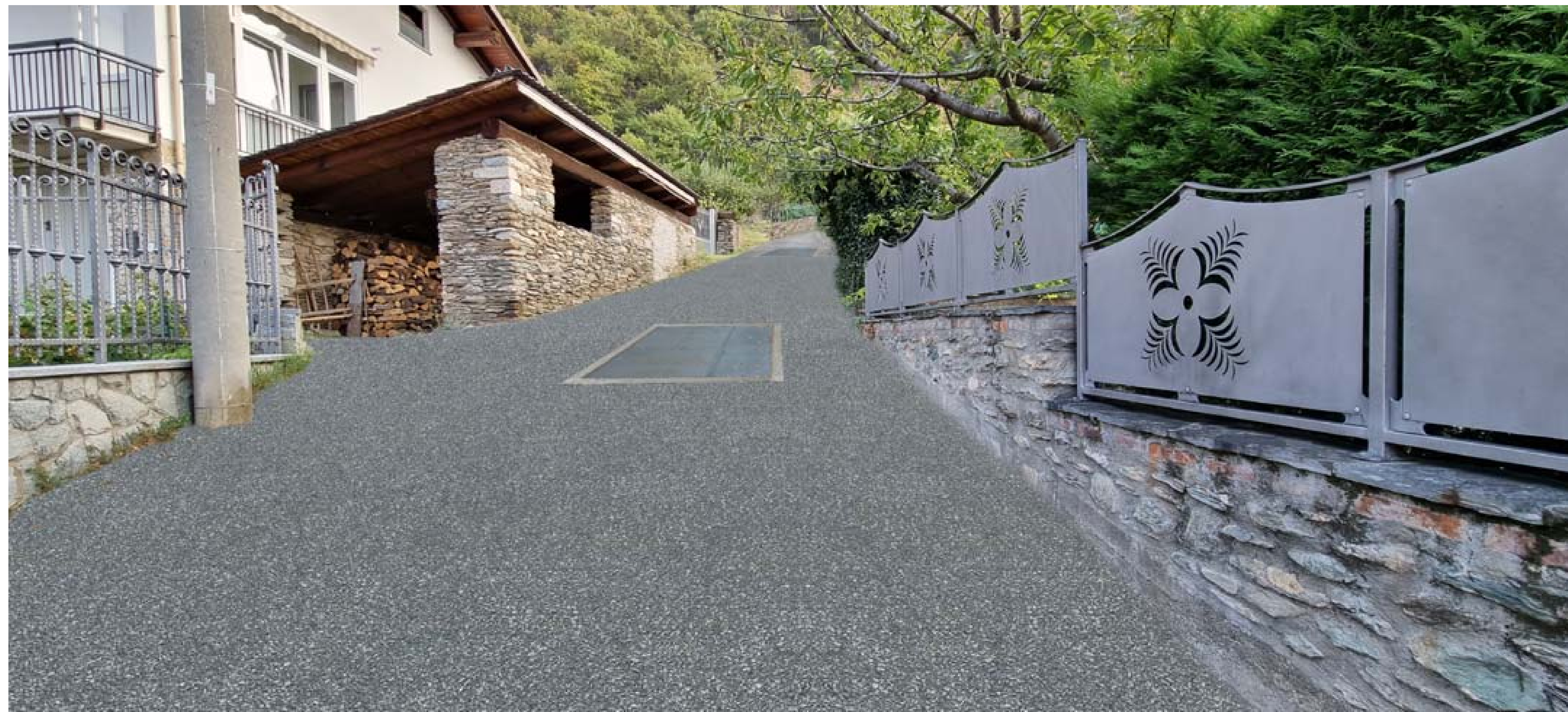
Foto 8 - Vista da valle del rio Bertabuello prospiciente la strada comunale - Stato di progetto