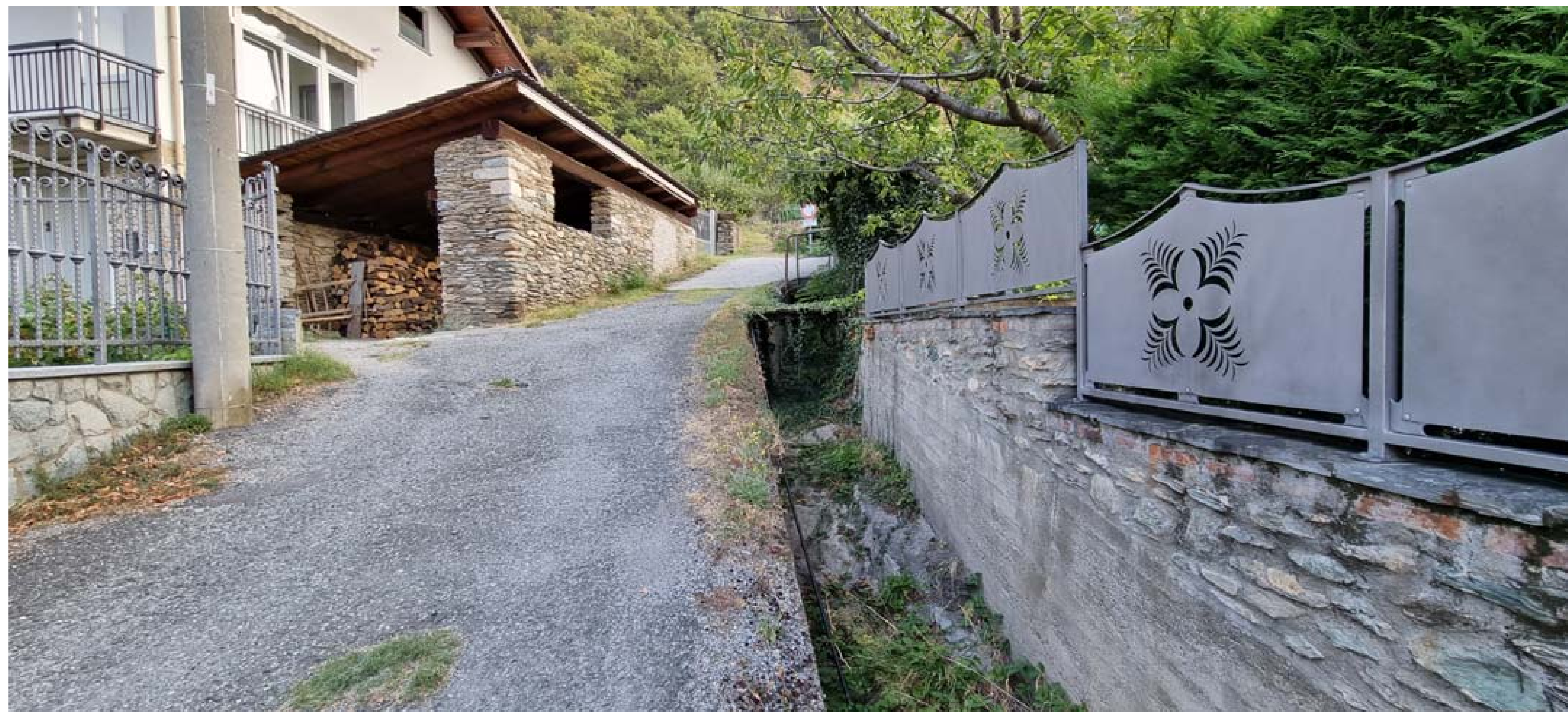
Foto 8 - Vista da valle del rio Bertabuello prospiciente la strada comunale - Stato di fatto