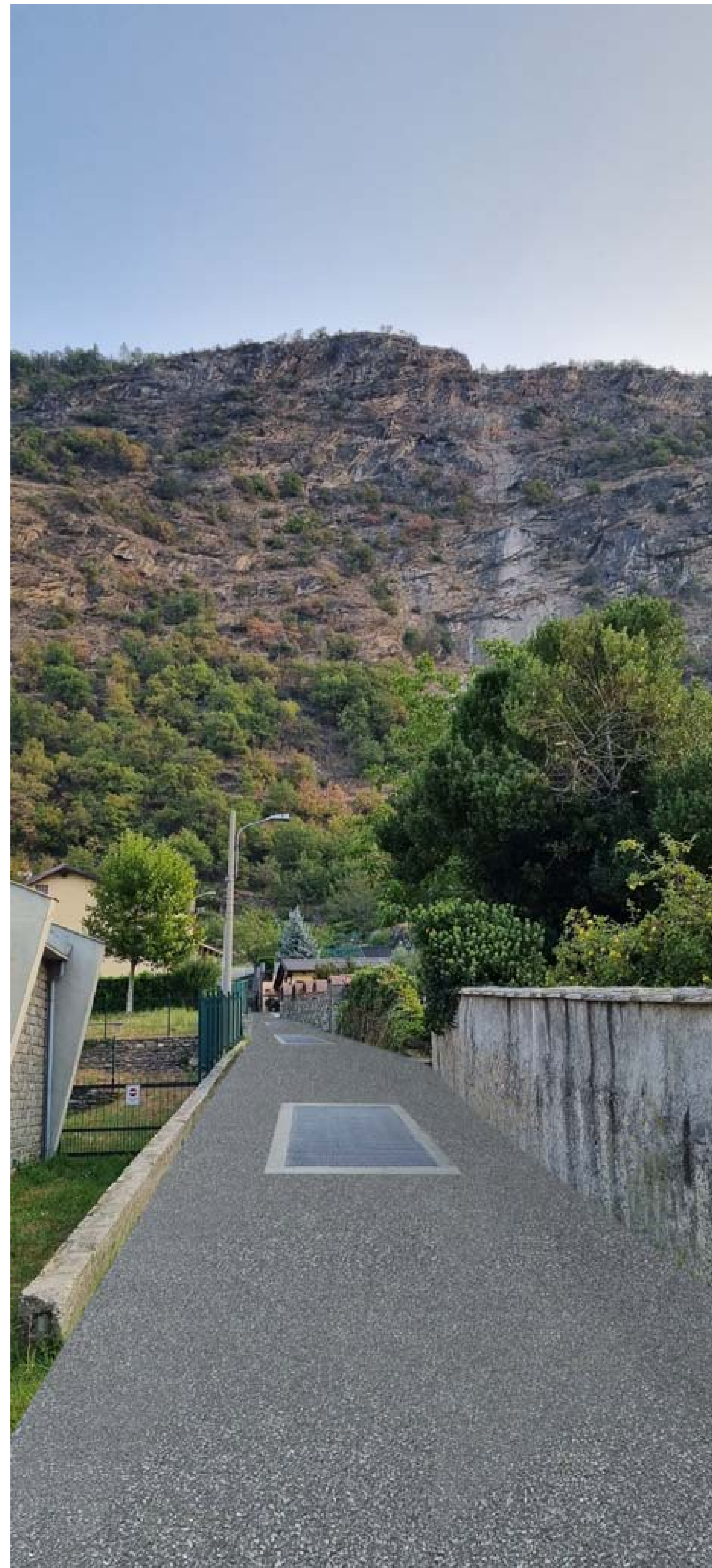
Foto 7 - Vista da valle del rio Bertabuello prospiciente la strada comunale - Stato di progetto