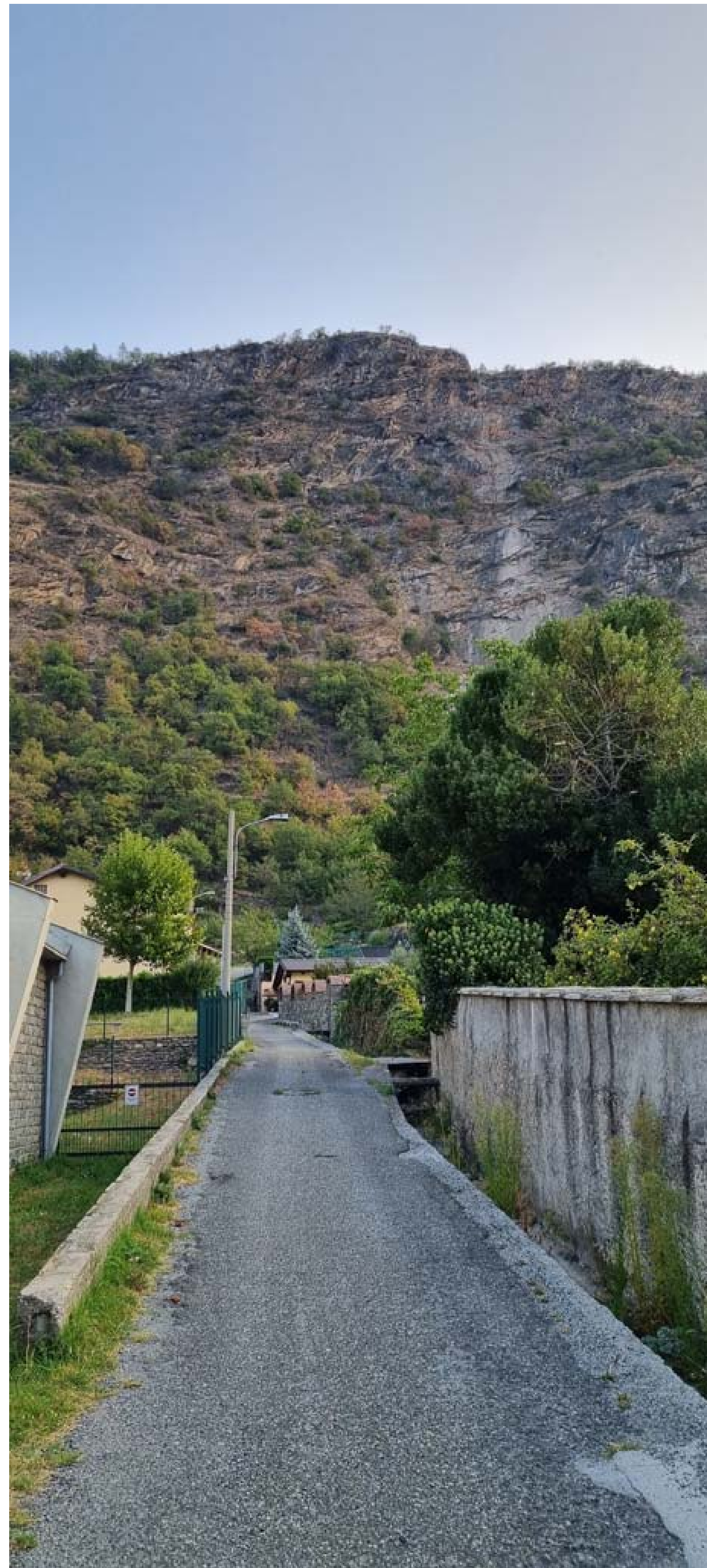
Foto 7 - Vista da valle del rio Bertabuello prospiciente la strada comunale - Stato di fatto